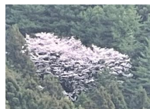
旧生(ふるう)の桜 今年もきれいに