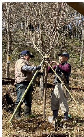
↑河津桜の植樹 ←枝垂桜の植樹