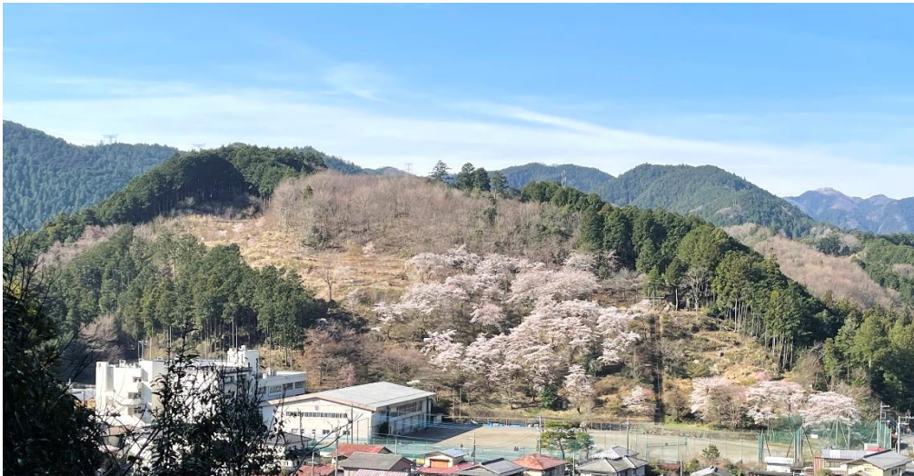
満開のソメイヨシノ 原市場の森 令和4年4月2日撮影