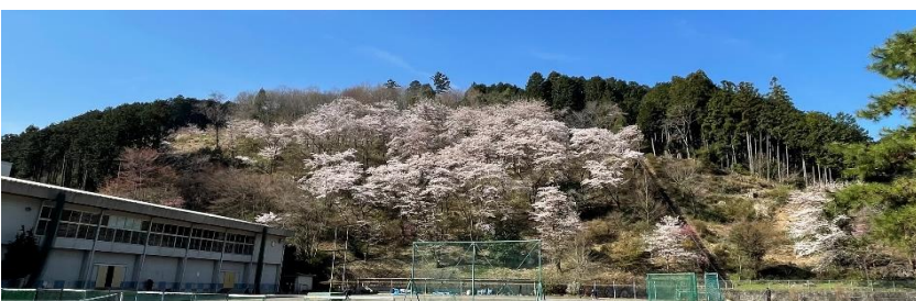
校庭から眺める桜 令和4年4月2日 撮影